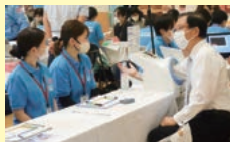
城陽市長 血圧測定の様子

最後に、快く会場をご提供いただいたアル・プラザ城陽店様に、この場を借りまして御礼申し上げます。