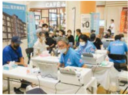
写真：2023年10月1日 アル・プラザ城陽にて