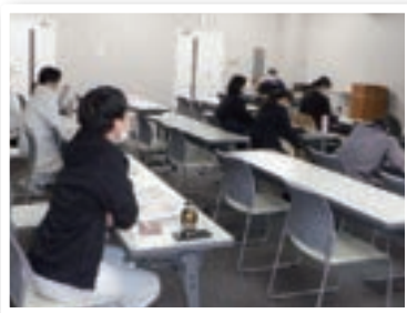
結核研修会の様子

講演では活発な質疑応答もあり、参加されている皆さんが熱心に聴講されている様子がうかがえました。結核研修会は、医師向け及び看護師・コメディカル等向けとし、毎年2回開催しております。また、今年度もさらにアップデートされた内容で講演を行う予定としております。興味をお持ちの皆様のご参加をお待ちしています。