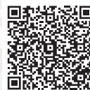
南京都病院だよりアンケート docs.google.com

今後の紙面の参考にアンケートにご協力ください。 左のQRコードからアクセスし南京都病院だよりを読んだご意見ご感想をお寄せください。