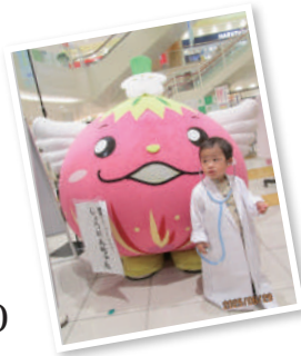
写真: 2025年6月 アル・プラザ城陽にて