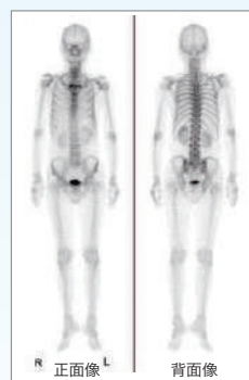
骨シンチ検査画像