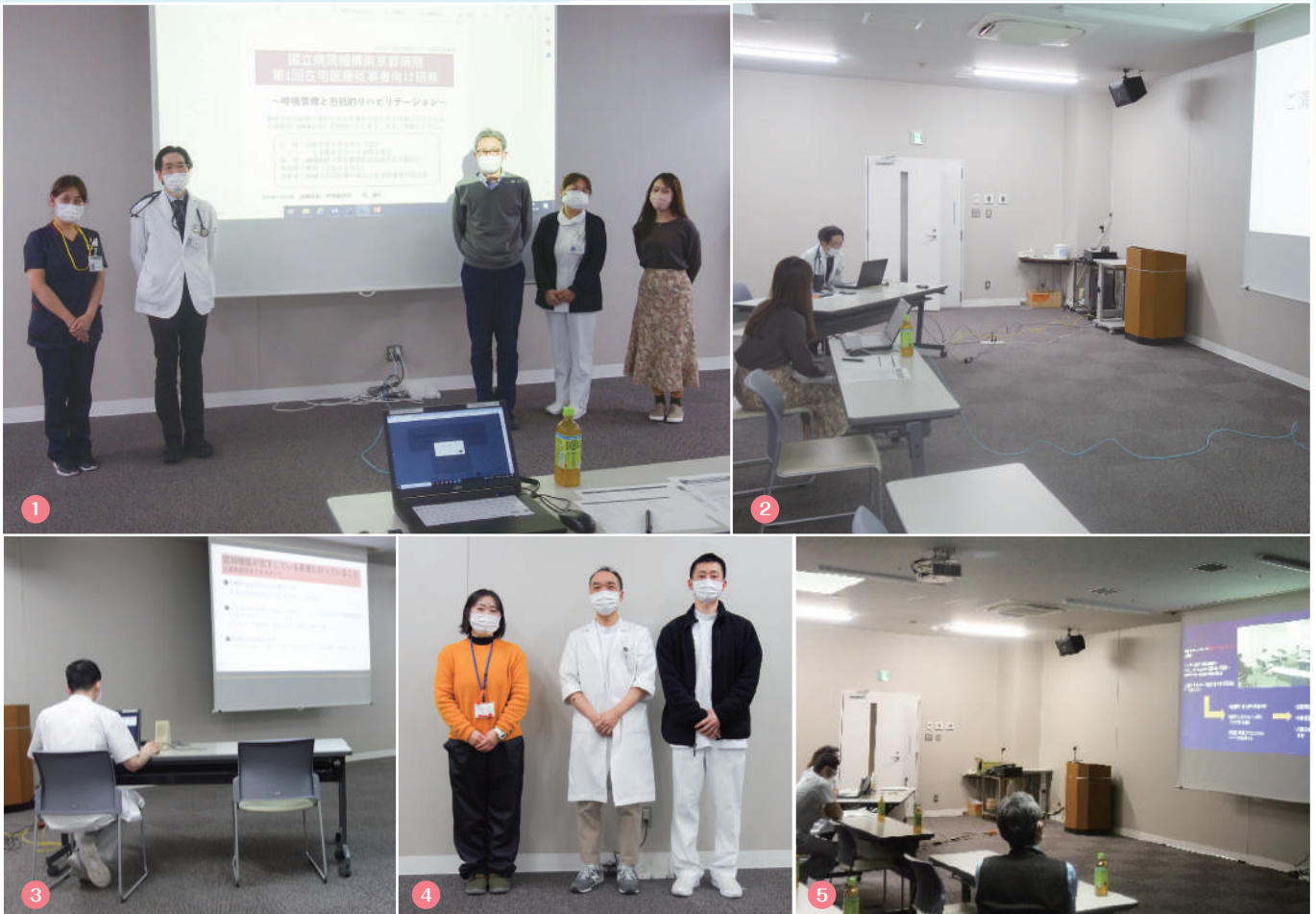
①②第1回 呼吸管理と包括的リハビリテーションの様子 ③④第2回 認知症の方の包括的サポートの様子 ⑤第3回 呼吸ケアセンターの取り組みの様子

令和2年からの新型コロナウイルス感染防止の観点から、昨年と同様にWEB研修の形をとりました (Cisco Webex Meetingsを使用)。3回あわせて合計で111名の方にご参加いただきました。