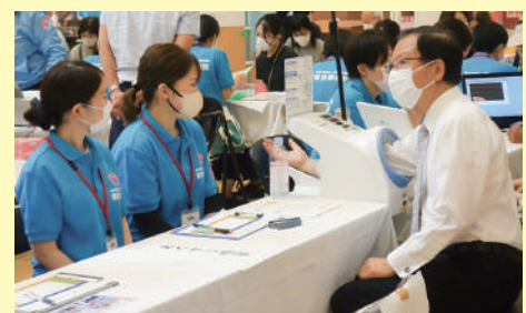
城陽市長 血圧測定の様子

最後に、快く会場をご提供いただいたアル・プラザ城陽店様に、この場を借りまして御礼申し上げます。